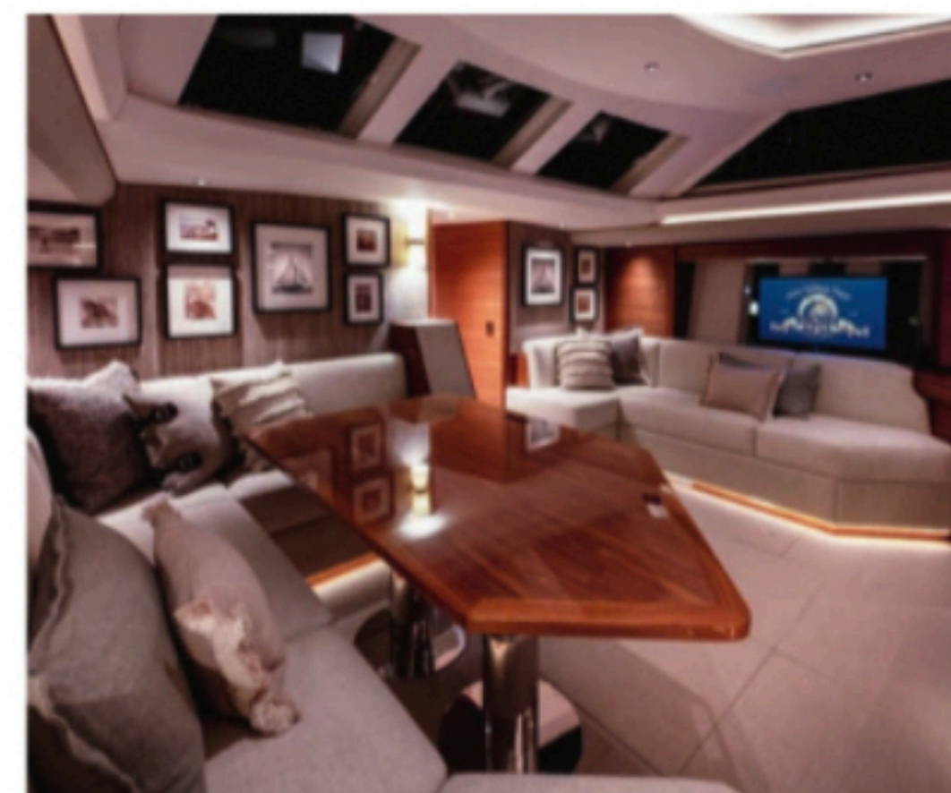
GOD STEMNING: Oyster 595 kommer med LED-belysning under dekk, som kan skape forskjellige stemninger etter behov.

Sheahan demonstrerer også hvordan moderne thrustere foran og bak har gjort det enklere å legge til. Ved å be-