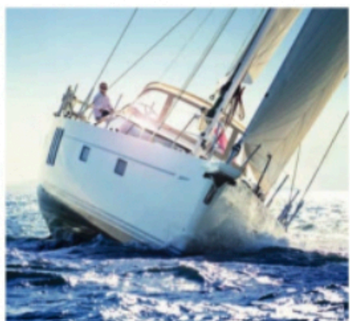
FAGFOLK: Oyster 595 er konstruert av folk med lang erfaring fra seiling, noe som blir tydelig når en begynner å studere detaljene.

Konstruktøren har åpenbart lang erfaring med livet til sjøs, og har plassert oppbeva-