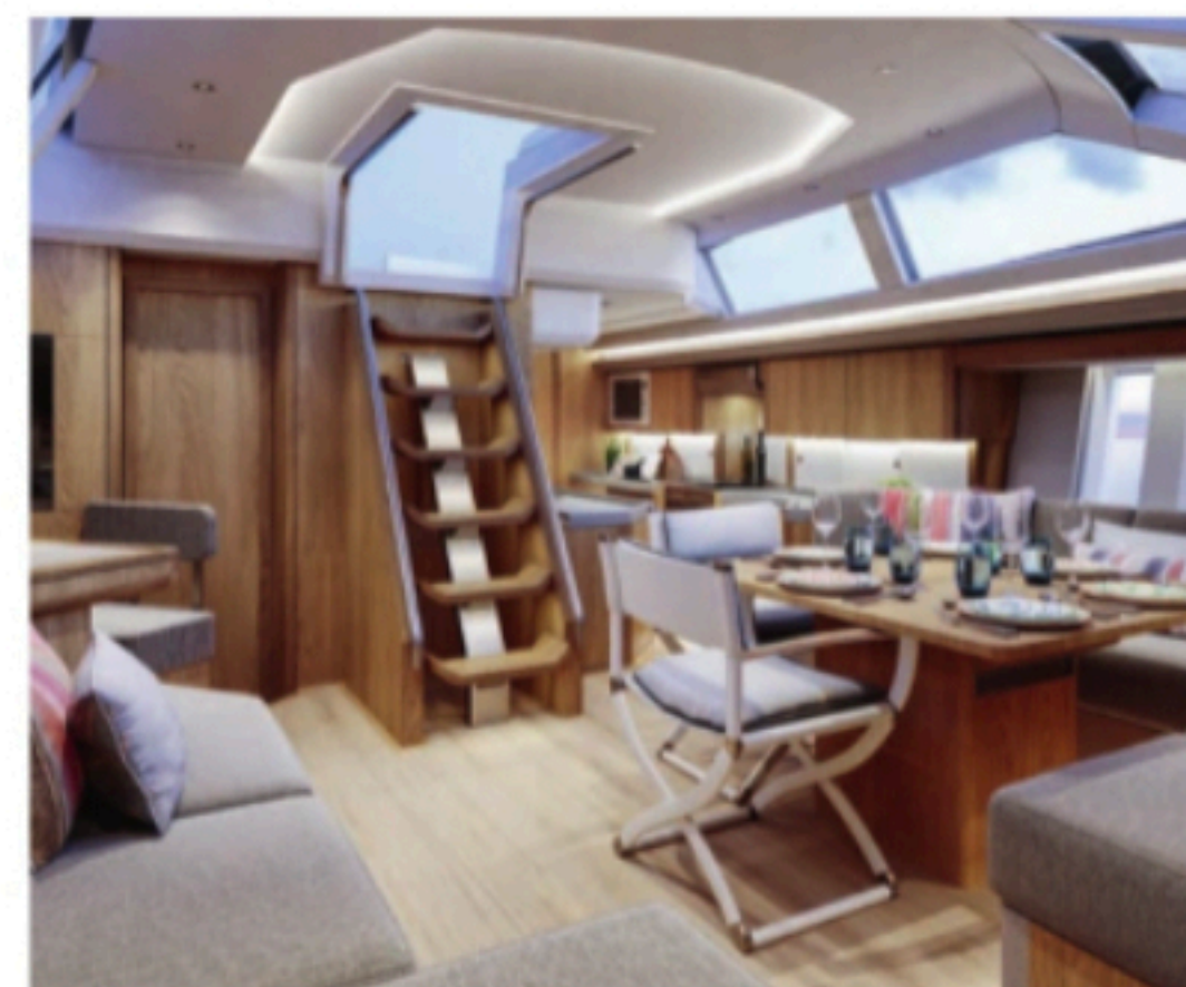
SOLGT 16: Produsenten opplyser at det har solgt 16 eksemplarer av Oyster 595 før den ble vist frem på messen i Düsseldorf.