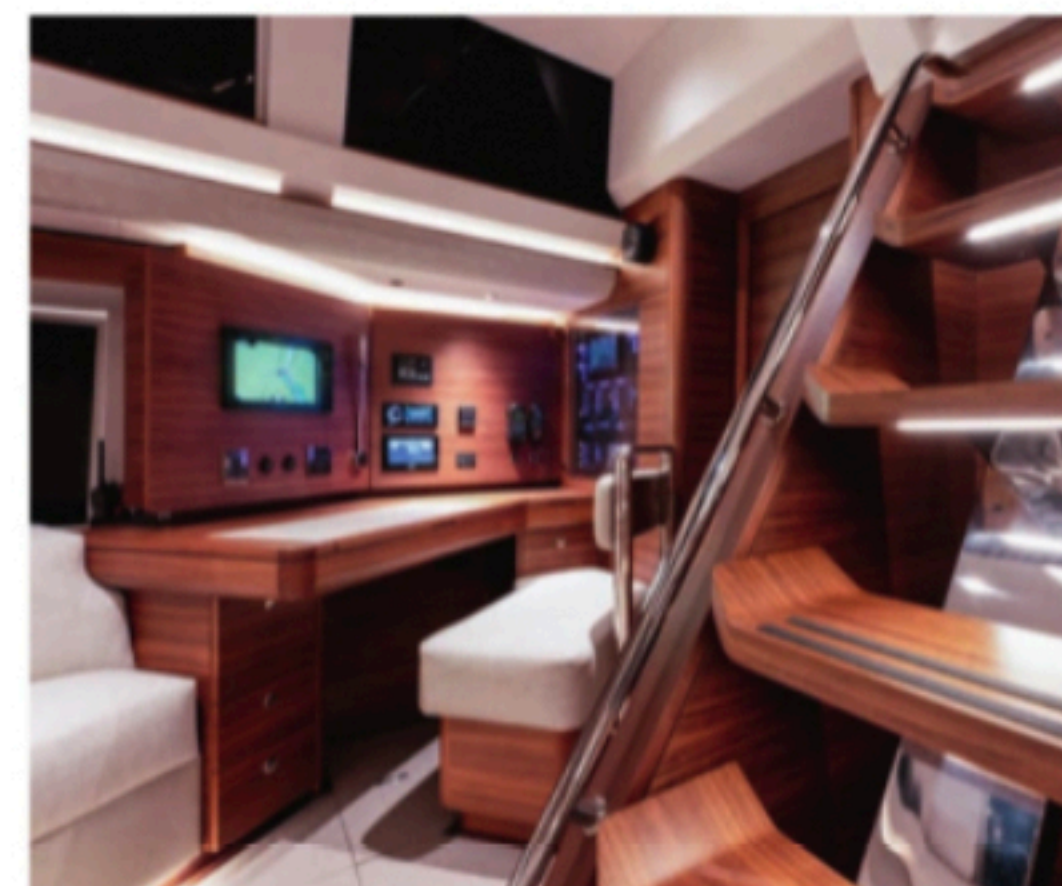
OVERSIKT: Nede i salongen har produsenten plassert en arbeidsplass for skipperen, med oversikt over alle systemene ombord i Oyster 595.