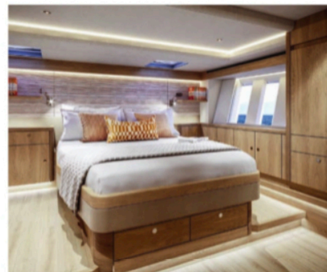
OWNER'S CABIN: Det er god plass i hovedlugaren ombord i Oyster 595, med store vinduer som slipper inn mengder av lys.

nytte begge samtidig, sender han båten sidelengs inn mot brygga, og gjør en 360 graders piruett for kamera. Alle kontrollene er samlet på et panel ved siden av de to rattene, og der finner du også et display med kartdata og oversikt over alle systemene ombord.