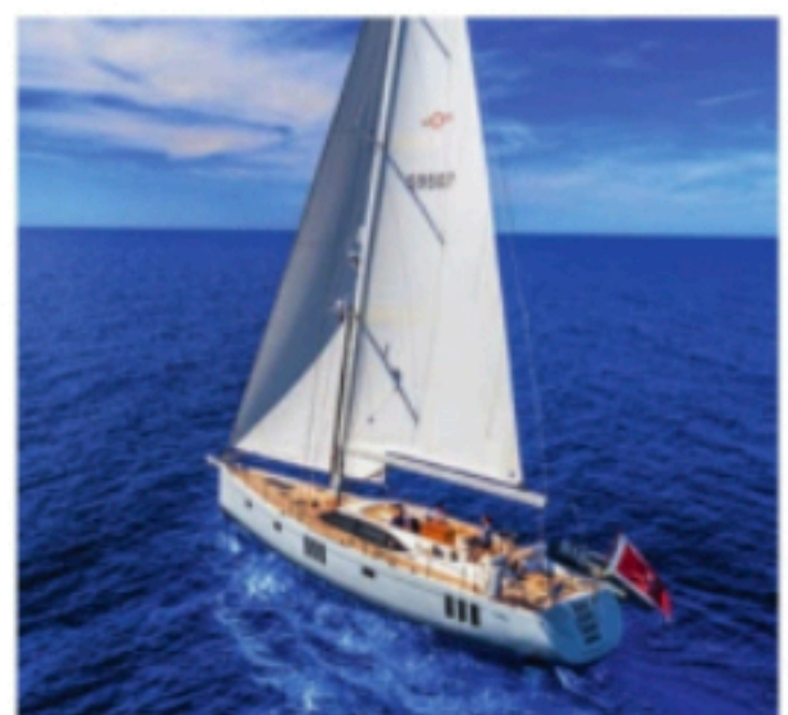
TUR FOR TO: Oyster 595 er 60 fot lang, og skal kunne seiles av to personer uten noen større problemer.

I stedet kan du åpne luken foran, hekte på kroken og heise den opp med en av de elektriske vinsjene. Hele dekket foran masten er en sammenhengende flate, der du ikke trenger å bekymre deg for å snuble i dekkslukene. Alle elementene som bidrar til å gjøre det enklere å seile båten,